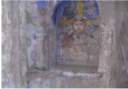
Yukarıda sözü edilen köy kilisinden resim